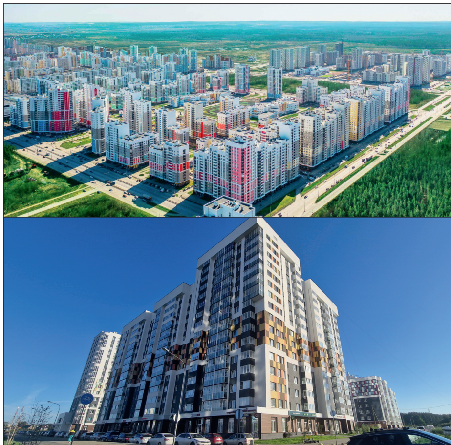
Рис. 1. Академический – новый жилой район Екатеринбурга

Академический – это самый новый, яркий и молодой район Екатеринбурга с общей площадью 1,3 тыс. га (рис. 1). Район рассчитан на 325 тыс. жителей, до 2026 г. планируется построить 9 млн кв. м жилой недвижимости. Это второй по величине после Сочи реальный пример реализации в России идеи комплексного освоения территории – мирового тренда в развитии современных городов